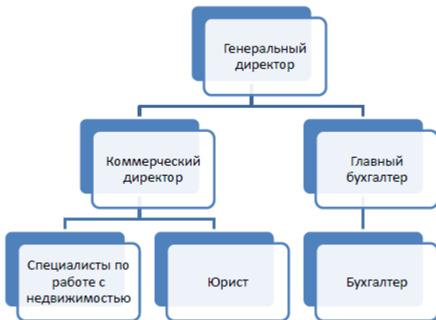
Рисунок 2 — Организационная структура ООО АН «Домотека»

Организационная структура ООО АН «Домотека» представлена на рисунке 2.