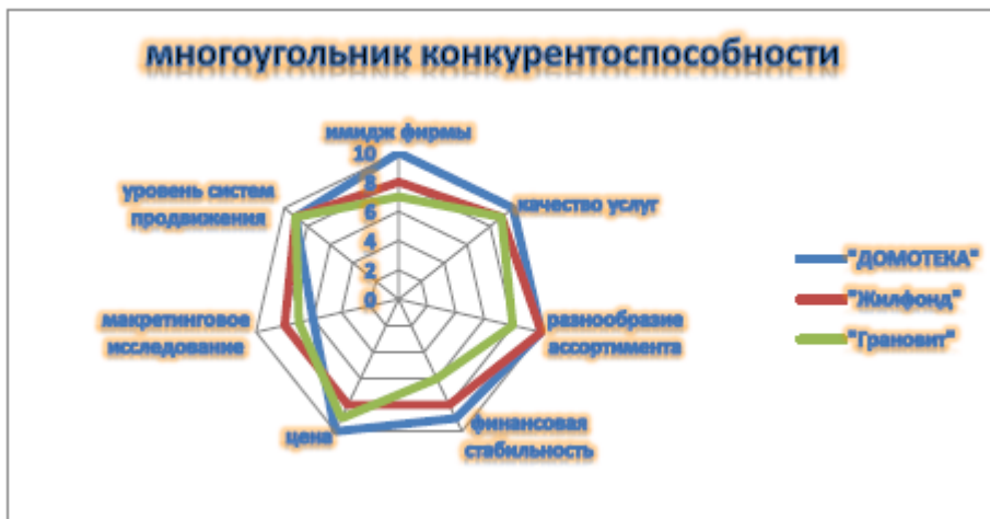
Рисунок 4 - Многоугольник конкурентоспособности

Итог анализа конкурентов - проведя балльную оценку основных проблем по степени важности для жизнедеятельности ООО АН «Домотека» можно сделать следующие выводы - ООО АН «Домотека» занимает устойчивое положение на рынке недвижимости, но руководству следует обратить внимание на уровень рекламной деятельности. В конкуренции очень большое место занимает реклама, так как именно благодаря ней увеличивается поток клиентов.