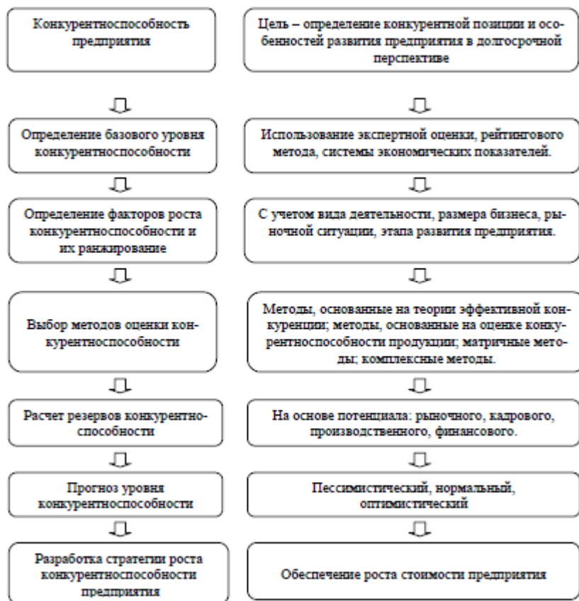
Рисунок 1 – Схема формирования оценки конкурентоспособности предприятия [9, с. 117]

Это позволяет сделать вывод о том, что общепринятой методики оценки конкурентоспособности предприятия в настоящее время не существует, что обусловлено наличием целого ряда недостатков предлагаемых подходов. Ни один из рассмотренных методов не является универсальным, и применение каждого из них обуславливается целью исследования, полнотой имеющейся информации и особенностями хозяйствующего субъекта и задачами его развития.